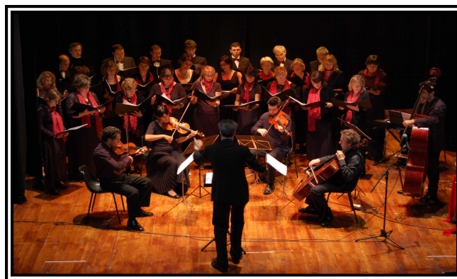
Olimpiadi di latino